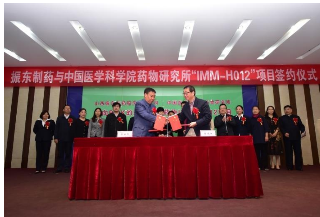
品牌科研. 成本回报