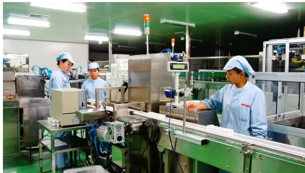
振东集团百亿片剂车间