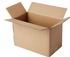
算细账：包装费用计算