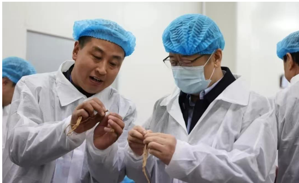
讨论药材质量影响因素