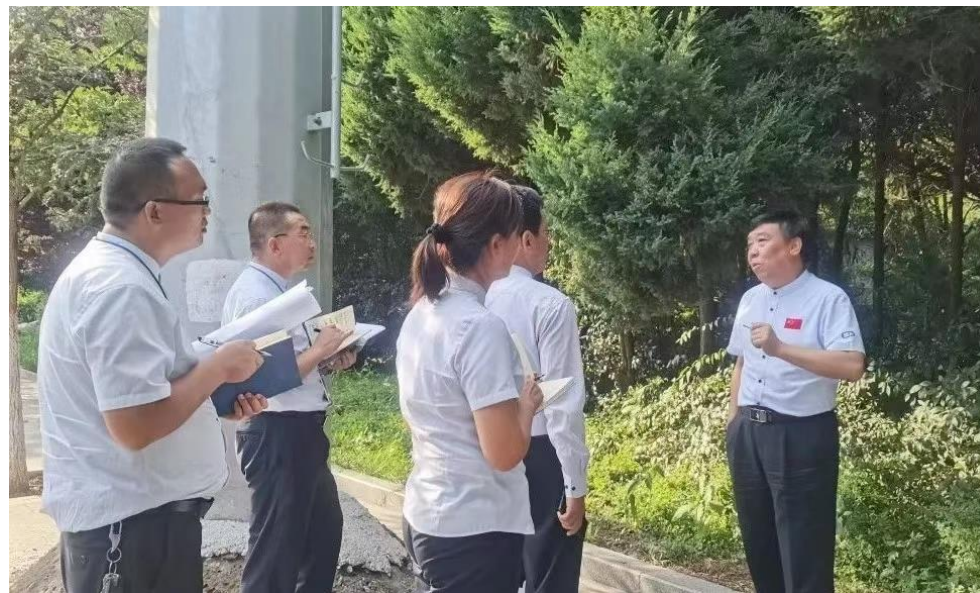
院长现场指导工作