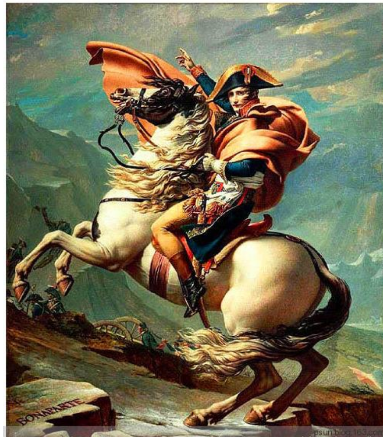
拿破仑替因劳累睡着的士兵站岗