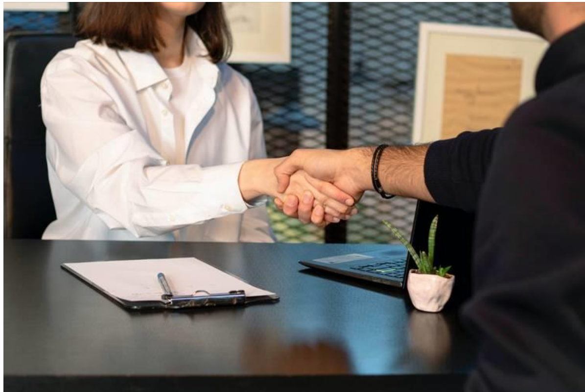
潜小梅初次犯错，得到宽容对待