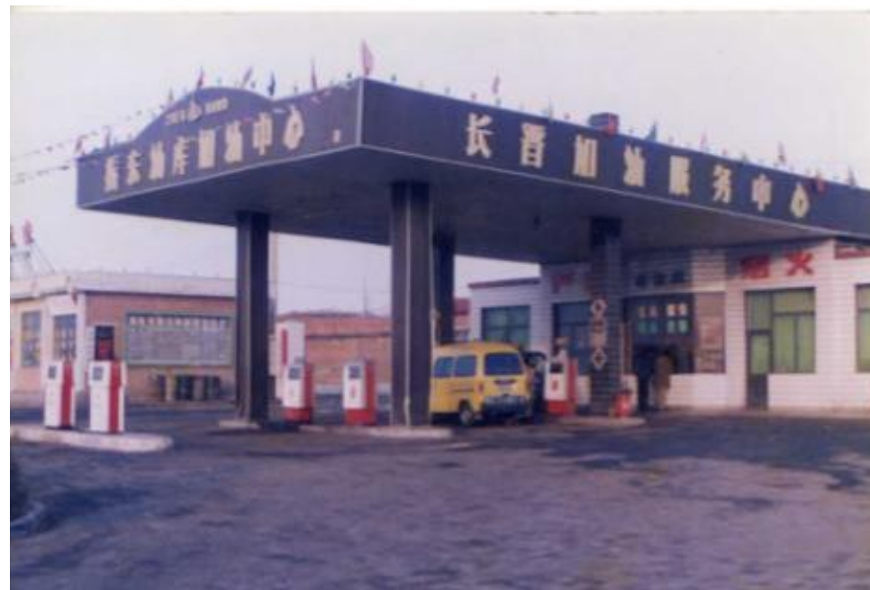
第一加油站加错油事件