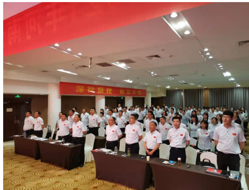
河南省区民主生活会现场